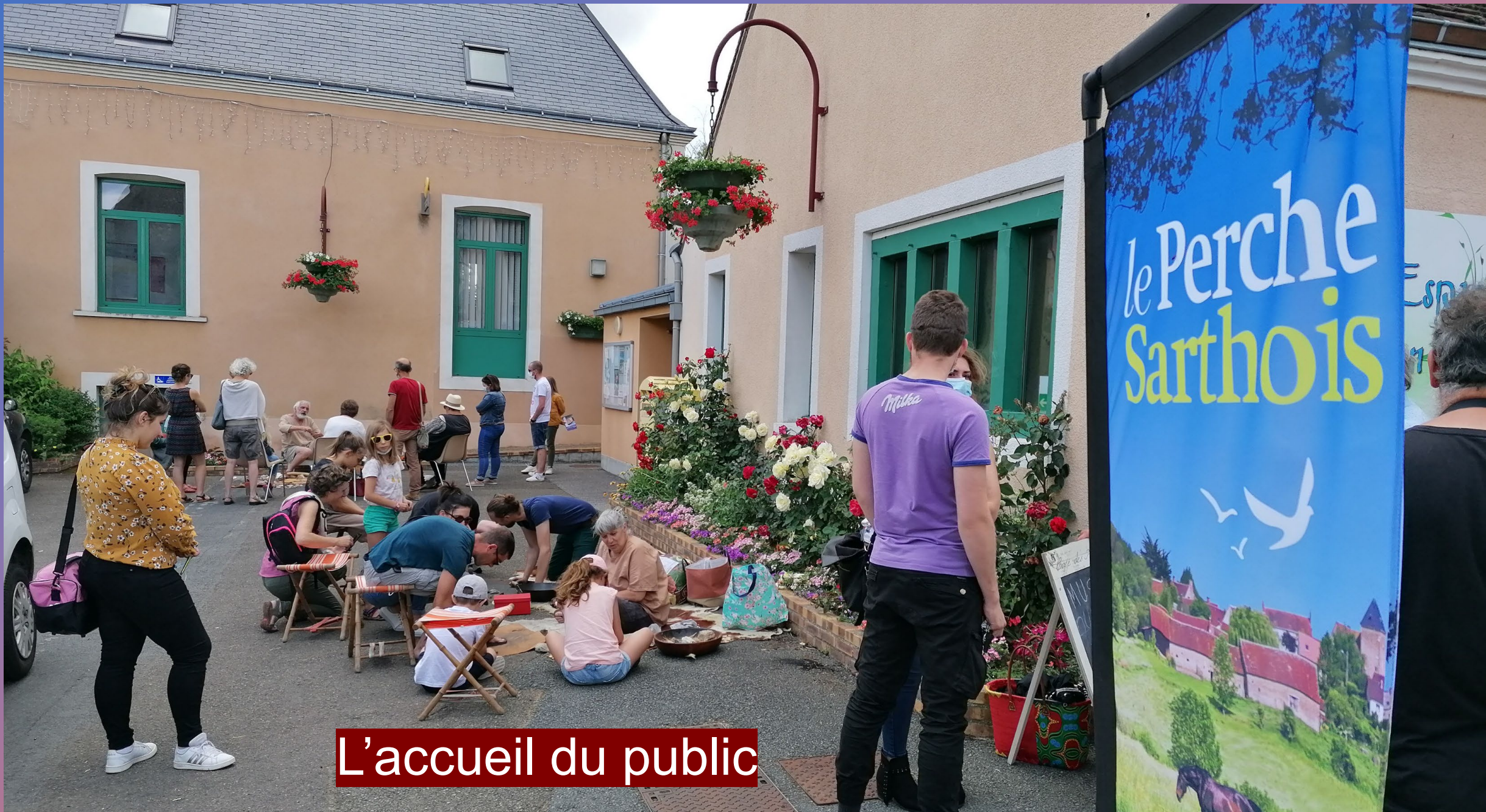
L'accueil du public